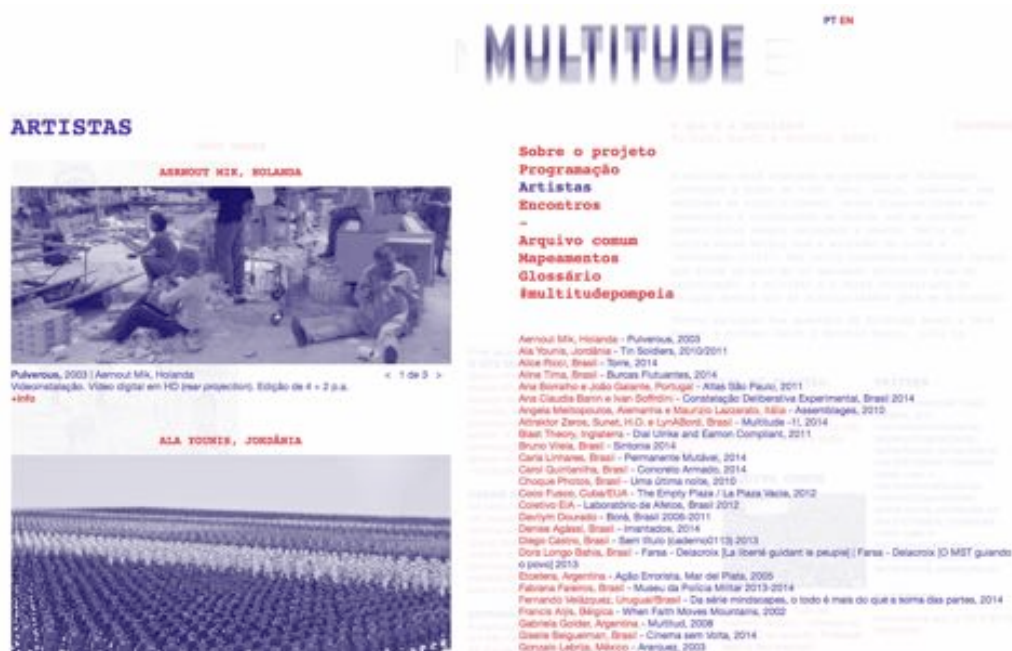
Imagem 1: <multitudeweb.jpg>

AVXLab 6 (2017, CCSP), que se desdobrou em residência artística, seminário, mostra e publicação em torno do chamado audiovisual expandido. São de fato dezenas de projetos que foram criados para se aprofundar o pensamento sobre uma cena, onde houve reflexão crítica acerca das atividades envolvidas na produção artística. Cada um deles se desdobraria em pontos-chave nas questões tratadas aqui, seja sobre o diálogo artista-curadoria, seja sobre terem vários deles viabilizado projetos que outras curadorias não viabilizariam. Vale dizer que jamais inseri um trabalho próprio em projetos de curadorias formais, talvez por acreditar nas razões que discuto no final deste texto. Creio que foram, cada qual em seu tempo, uma forma de reflexão que se colocava com alguma urgência no momento em que os projetos aconteciam. Nesse sentido, foram todos eles projetos que arriscaram falar do que ainda não estava estabelecido, funcionaram como pesquisa, como pensamento a respeito da cultura, da comunicação e da arte.