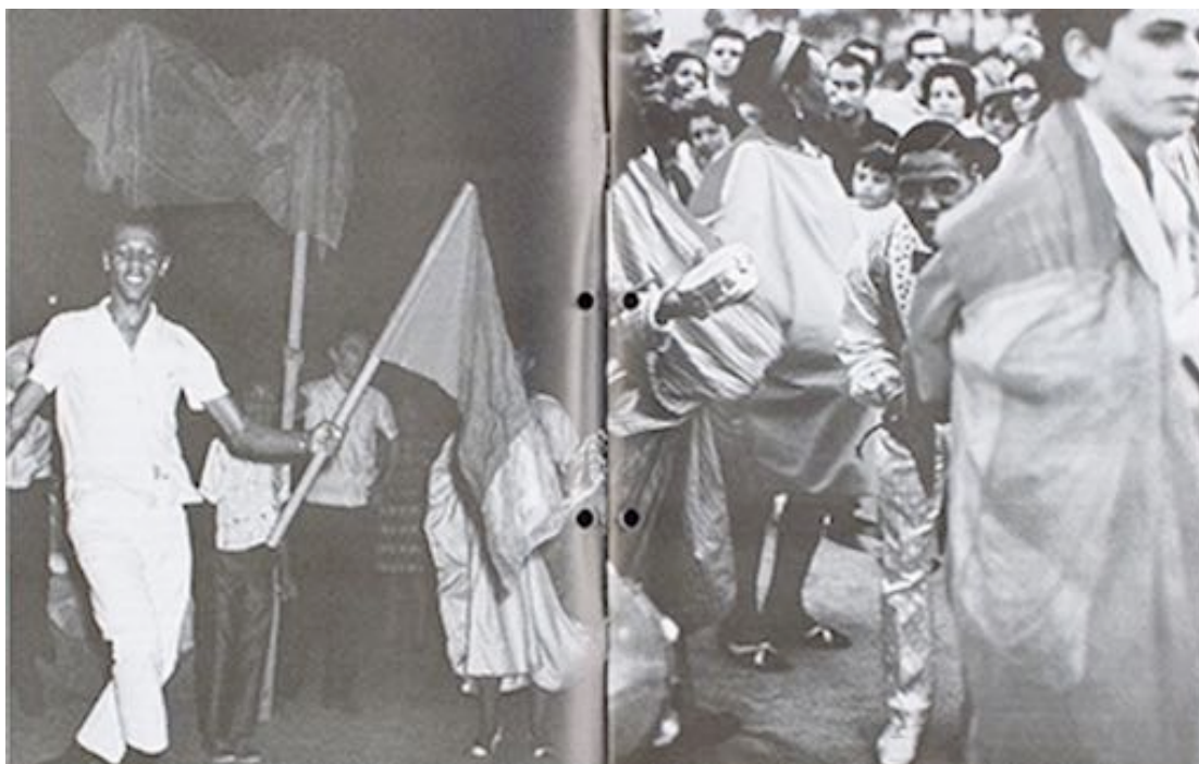
Imagem 4: <Apocalipópese.jpg>

Apocalipópese, 1968, no Aterro do Flamengo, fora do museu: um misto de instalação, exposição e manifesto, talvez o projeto mais ambicioso do programa político de Hélio Oiticica. "A manifestação mais importante de seu desejo de intervir na esfera pública, aspirando criar uma comunidade que respondesse e ampliasse o horizonte de emancipação que seu trabalho implicava" (2015).